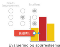
Evaluering og spørreskjema