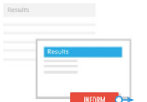
Kontakt og e-mail skjema